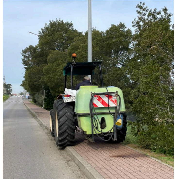
Aplicação de Produto Fitofármaco de controlo de ervas infestantes