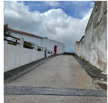
Limpeza e higiene urbana