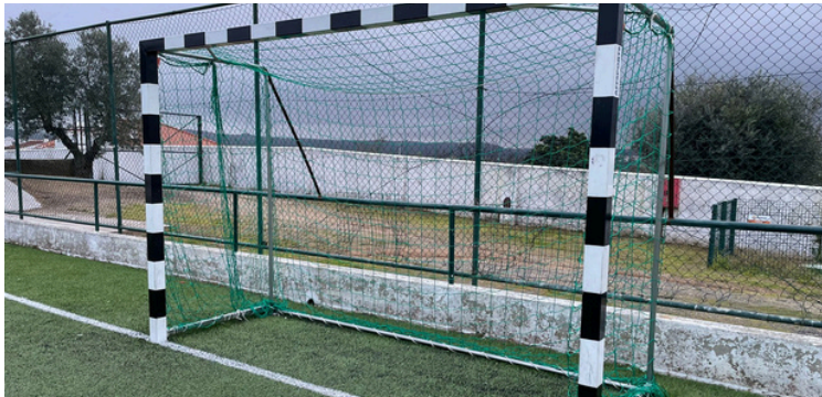
Substituição de equipamentos danificados