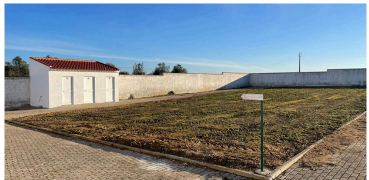
Limpeza e manutenção do cemitério