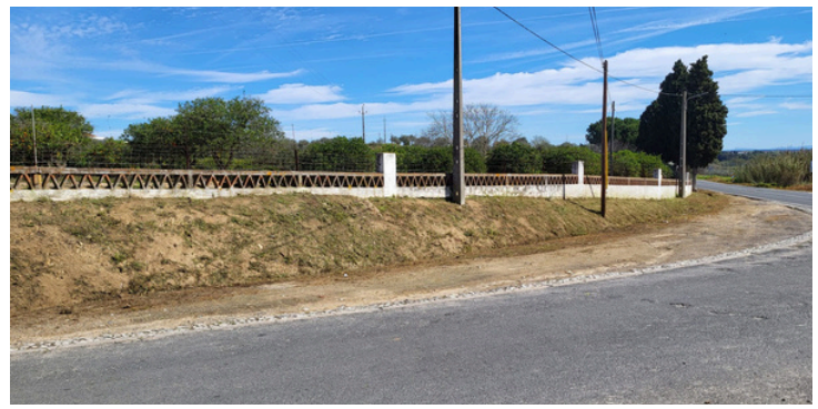
Limpeza dos cruzamentos