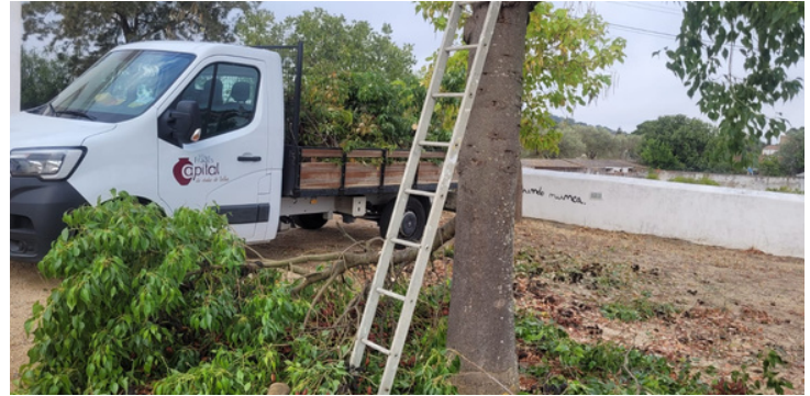
Poda e limpeza de árvores