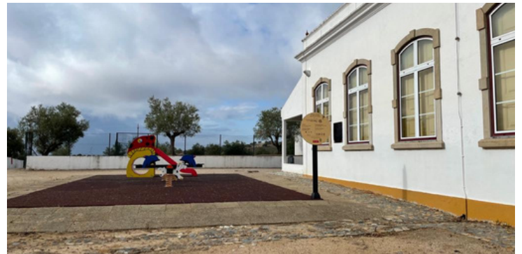
Limpeza e manutenção da Escola Fialho de Almeida