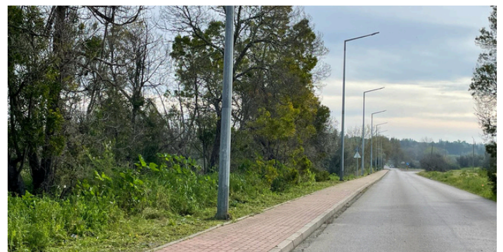
Limpeza do caminho pedonal