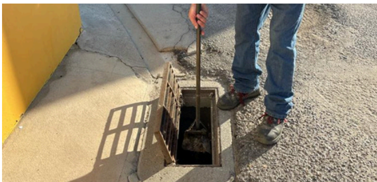
Limpeza de sarjetas e sumidouros