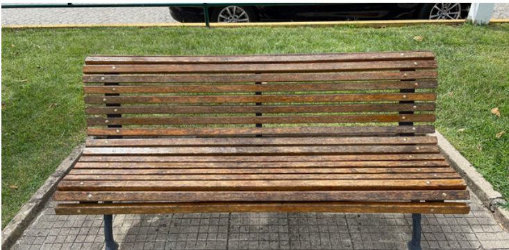
Manutenção de bancos públicos existentes e instalação de novos