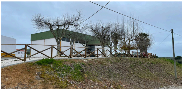
Limpeza de barreiras