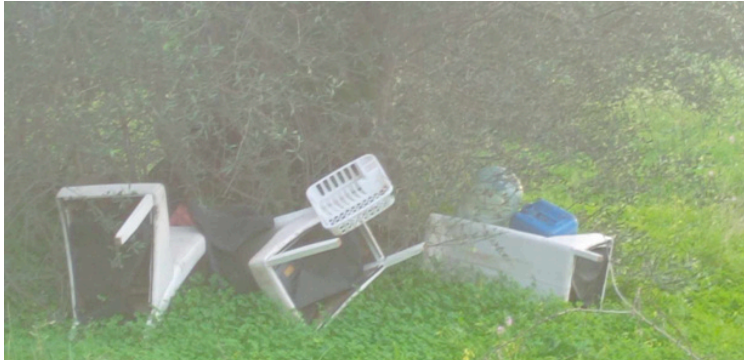
Recolha de monos