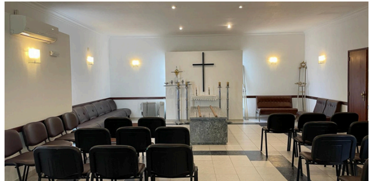
Pintura interior da casa mortuária