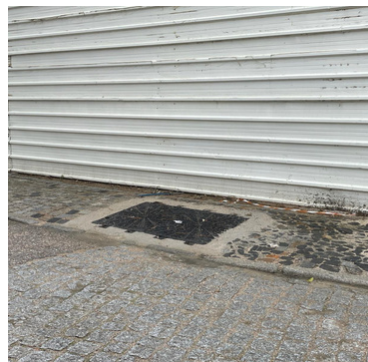
Reparação de tampas e grelhas