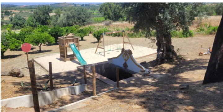
Limpeza e manutenção de espaços verdes